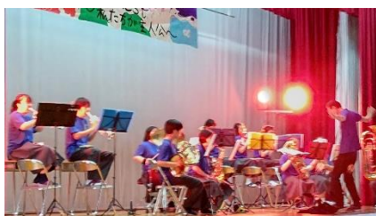
吹奏楽部の演奏の様子。指揮は3年主任のF先生