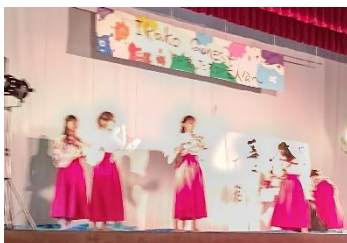
書道部のパフォーマンス キリッとした姿が印象的