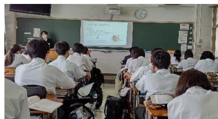
実習生による保健の研究授業の様子

○実習生の指導をとおして、教員自身が授業でのICT活用の方法や観点別評価の方法などについて、見識を深める貴重な機会にもなりました。