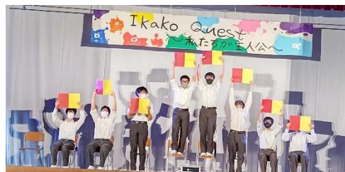
2年ステージ発表 ユニークなダンスでクラスの団結を表現