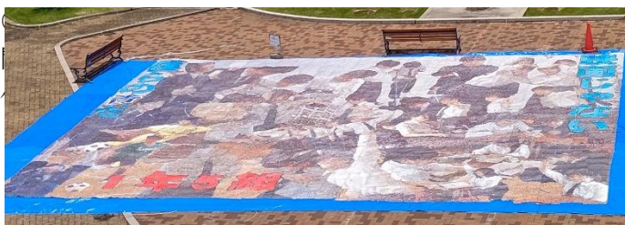
1年展示発表 中庭一面の大絵画から、制作過程でのがんばり、クラスの団結の様子がうかがえる。