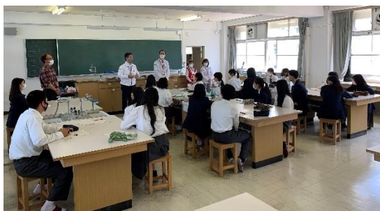
2年「コミュニケーション応用」の授業

○4月25日(月)5限目に行われた2年「コミュニケーション応用」の授業には、コープこうべより、4名の方が参加され、フードロスや子育て支援など、生徒が考える身近な生活上の課題について、アドバイスをいただきました。今後、1年「コミュニケーション基礎」などの授業にも参加いただく予定です。生徒たちの学びが一層豊かになることを期待するとともに、私たち教職員も学びの機会にできたら素晴らしいと思います。ご担当いただく先生方に感謝申し上げます。