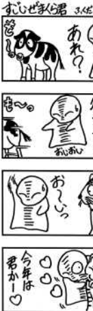
今年が新年、みんなでかーっ! (笑)