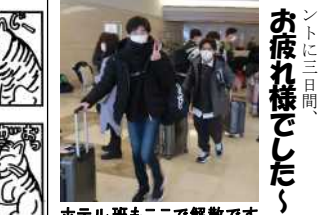
ホテル 班もここで解散です

「せ、先生、お腹が...」などの体調不良に即座に対応するためです。班のお医者さんです。 美化委員は、ホテルの部屋が『ゴミ屋敷』と化さない様に目を光らせてと共、破損調査用紙にキツチャリと記入をします。メチャクチャ重要な役割です。ホテルを出るときに皆さんお役ゴメンとなります。