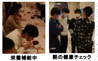
朝の健康チェック

ついに修学旅行も四日目、帰路につく日となりました。突如舞い込んだ日本沿岸を覆う津波警報・注意報に一時はどうなる事かと心配しましたが、なんとか無事予定通りの行程でスタートができました。 この日は朝食を取ってから一旦部屋に戻り、荷物の最終チェックです。「忘れ物なし!」 荷物の最終チェック中