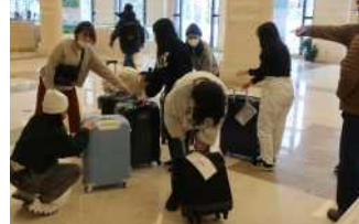
荷物の最終チェック中

保健係&美化係 こんな仕事しました ホテルの室長の働きは前号で紹介しましたが、では保健係と美化係はどんな仕事をしていたのでしょうか? まずは保健係。一日数回の検温を班の保健リーダーに記入し、担任に報告します。