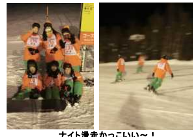
ナイト滑走かっこいい〜!

いよいよナイタースキーの開始だ! 「おっおっおっ!」 この日は17時前後から 夕食です。 「メッチャ腹減ってるで という者も居れば、 「まだ腹減ってへん!」 という者もあり。では何 で今日はこんなに夕食が 早いのか?それはね、 ナイタースキーがスタート するからなんです。 18時、続々とグレンデに 現れる生徒達、