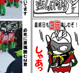
最終日も倍楽しむぞ!