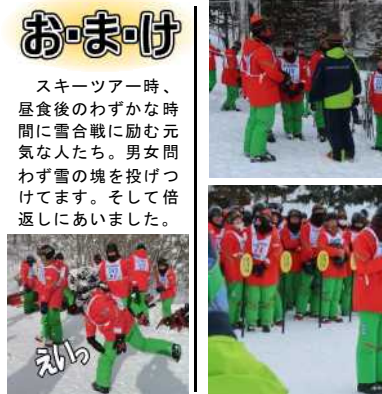
最後の教え聞いてます

さらばスキー講習 開校式があるという事は 閉校式もあるのです。修学 旅行三日目、15時前に閉校 式が行われました。 「神戸ではできない体験で がとうございませう。そう すれば、 生徒代表の挨拶でした。二 日半の講習ではありまし たが、これで君達もスキー or スノボの達人*です。さあ、 夜のナイタースキーでその 達人技を見せてくれ! ※【用語解説】達人 ある分野に関して高みを目 指し極限まで技を洗練させ た人を指す言葉。 (Wikipediaより抜粋)