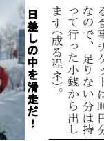
雪の山頂でワン・ピース(笑)

いよいよナイタースキーの開始だ! 「おっおっおっ!」 この日は17時前後から 夕食です。 「メッチャ腹減ってるで という者も居れば、 「まだ腹減ってへん!」 という者もあり。では何 で今日はこんなに夕食が 早いのか?それはね、 ナイタースキーがスタート するからなんです。 18時、続々とグレンデに 現れる生徒達、