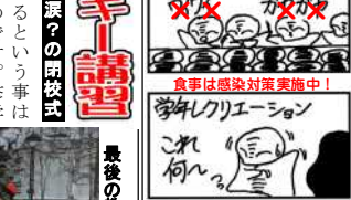
食事は感染対策実施中!