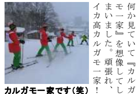
カルガモ一家です(笑)