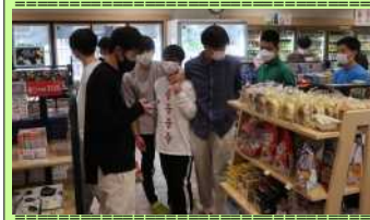
館内のSHOPでも楽しそーにしていますよ