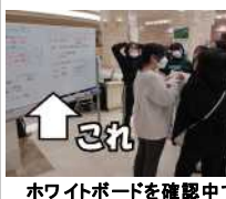
ホワイトボードを確認中です

旅行中の指示はすべてしおりに書いてあります。しかし何事も予定通りにいくハズはありません。そんな予定変更に対応するのが『班長会議』と『ホワイトボード』です。特に『ホワイトボード』は部屋への導線に位置し、必ず皆が目に見えます。見ないと痛い目合います。ほら(笑)