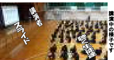
講演中の様子です