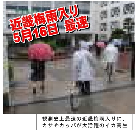
観測史上最速の近畿梅雨入りに、カサやカッパが大活躍のイカ高生

「コロナ対応」悪戦苦闘! 私ら教職員にとっても初の経験であり、数々の多さにより、対応が充分にできたとはとても言えません。教職員と同じく、保護者の方もコロナに関しては多大なる不安を感じて居られるでしょう。なので今しばらく、『コロナ』という共通の敵に立ち向かうため、共に協力しましょう。お願いします! 天性人語45th 私は野菜が苦手である。今こそ出された野菜は全て食べる様にしているが、小さい頃は食べるのが嫌で嫌で仕方なかった。▼特にトマト。親戚の家に行くときに『必要な栄養だから食えなさい』と言われ、嘔吐しながら無理矢理食べた記憶がある。しかし、こんなに苦しいのに本当に栄養になるのだろうか、とよく思ったものだ。▼日本では『苦しい事に耐える事が美德』という風習があるが、それも時と場合がある。苦しいに押しつぶされるくらいなら、そこから逃げる事も必要である。▼話を戻すが、嫌いなトマトは食べない、というのも一つの手段だが、食べた方が良くに決まっている。そこで、提供する者ができるだけ食べやすい様に調理を工夫する事も一つの方法だろう。そこは調理人の腕の見せ所である。▼我々教師は、生徒にとっての『人生の調理人』かもしれない。生きる上での様々な苦しさや、楽しさに変えていくための調理人に。(福田)