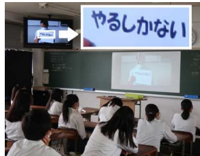
授業式のワンシーン

「この間は上手くいったのに、何で今日は音が出ないネッ?」 そうです、昨日できた事が今日はできない、これが『Zoom』のデメリットです。予定より10分あまり遅れてのスタートとなった始業式、やはり今回も校長先生の「文字用紙」が「毎日10キロ...後悔」