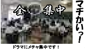
ドラマにメチャ集中です!

韓流ドラマの鑑賞を行っていた時は、めっちゃグッドなシーンだった様です。山奥でイケメン兵士が言っています。 「私は銃を持っている!」 「夏休み) 延長になると思つて課題やってへんかったら?」 こういうのを『後の祭り』というんです。状況認識能力の低い者が陥りやすい異世界でした。 数学II未選択者は2限目から授業です。どれどれ、急きよ時間割変更で授業になった『ハンゲル基礎』を覗いてみる!」