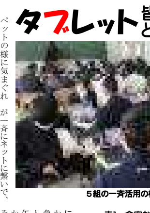
5組の一斉活用の様子

皆で使うとどうなるの? タブレットの様に気まぐれで、しょっちゅう思いと違う動きをして主人を困らせるモノ、なぐんだ?」