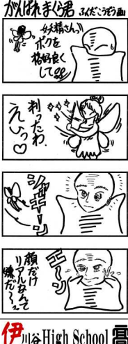
伊川谷High School 高

マスクを外してご飯食ベ、そのまま勢いでノーマスクな会話。友との楽しい会話はしつかりマスクをしてからしよう