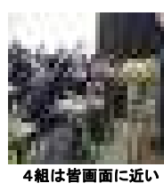
4組は皆画面に近い

「先生、7台が更新にかかって使えません。ウィンドウズである『勝手な更新作業で使いたいとき