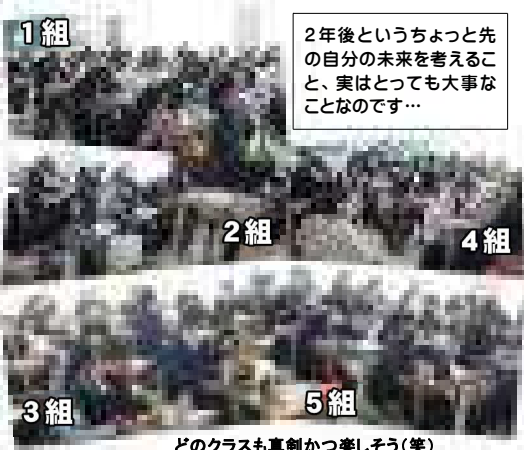
どのクラスも真剣かつ楽しそう(笑)