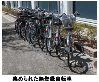
集められた無登録自転車 友の笑顔大切に...伊川谷高校 吉学 年

本来であれば、全員キチンと学校に登録申請を出して初めて許可される『チャリ通』ですが、コロナ下において、一時的に無登録チャリ通もOKにされています。しかし時は流れ、時代は戦国時代さながらの2学期に突入!そして9月1日からは『チャリ通は必ず登録をして許可を得る』という従来方式に戻りました。 職員室裏手には、登録を促すために無登録車が集められました。これらのチャリ通は、校内登録の上、100円の監禁代で黄色(学年カラー)の番号付きシールを貼られます(電チャは150円の緑シールになります)。チャリ通の皆さん、ステキな乗り方をし、道行く小中学生の目になって、な おなかいい♡