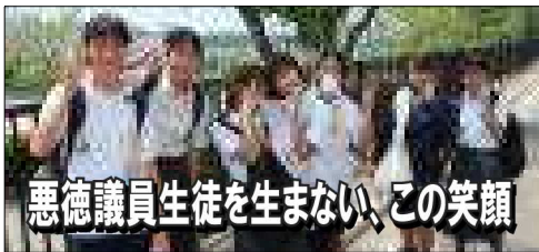
悪徳議員生徒を生まない、この笑顔

実は、あまり知られていない事ですが、伊川谷高校には、たまたま「悪徳議員生徒」が出現します。この「議員生徒」達は、国会さながらの答弁を繰り返すのです。 「何で掃除行かなかったんや!」 「私に悪くありません」 「何で週末課題やらへんかったんや!」 「忘れてました」 「何で期日守れへんのや!」 「記憶」が「ありません」 「どういつ事か判っているのか?」 「私は悪くありません」 「どうして約束破るんや!」 「聞いてません!」 まさに悪徳議員の様に、すべてを「聞」に葬り去ろうとします(善良な議員の皆さん、ごめんなさい!)。これでは「大事な提出物」もなかなか提出されない訳