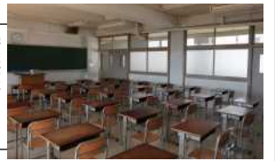
学校が再開した 右の教室が何 組か調べよう

「うちの子、毎日グー ムばかりで...」 そりゃあアカン事 ですが、後々エラい事 になって自己責任 です。時が来たら苦 しんでもらいますよ 。今、一番心配な のは「真面目な子」 です。 「課題できへん〜」 「プリント全部終わ りません」 「授業中泣き出す者 。プリント全部終わ らないうちの子、毎 日グームばかりで...」 そりゃあアカン事 ですが、後々エラい 事になって自己責任 です。時が来たら苦 しんでもらいますよ 。今、一番心配な のは「真面目な子」 です。