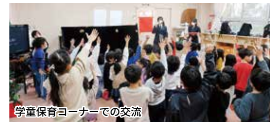
学童保育コーナーでの交流