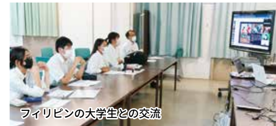
フィリピンの大学生との交流