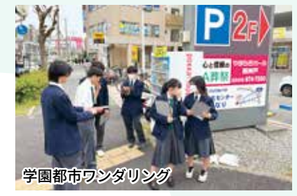
学園都市ワンダリング