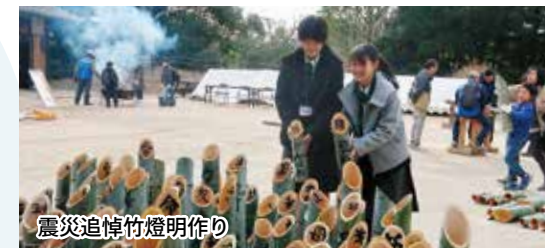
震災追悼竹燈明作りの