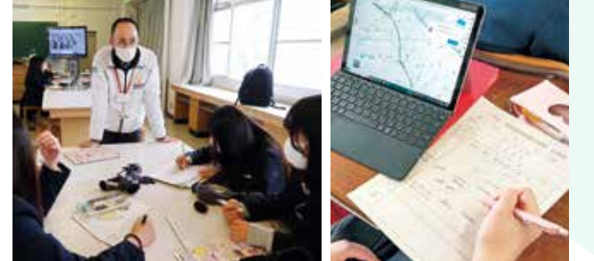
研究の成果を事業者に提案し、情報を共有します

3年生では 研究成果を主にアドバンスLabで「卒業論文」や「卒業作品」としてまとめ、行政機関に政策提言、大学や企業に事業構想として提案します。またActive Lab IIIでは、マレーシアのテララズ大学と成果をリモートで共有しながらより良い日本社会、国際社会づくりに必要な提言・提案を発信します。3年間の探究学習の体験から、自己の進路を文理の枠を超えて主体的に開拓し、夢の実現を目指します。