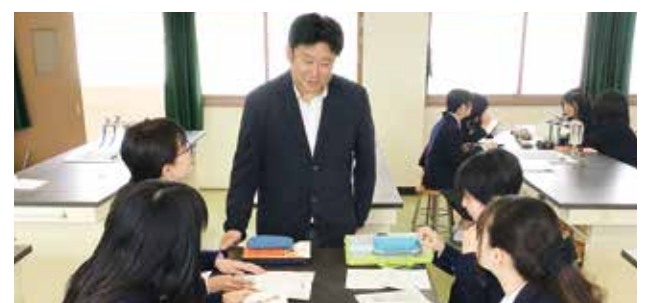
大学や行政、企業から課題研究のヒントを探ります

1年生では 学園都市コンソーシアムを活用しながら、知識、情報を習得し、探究活動の課題を探ります。ナレッジLabでは主に講義や情報収集、体験ワークを実施し、Active Lab Iではフィールドワークを主体とした活動を展開し、ポートフォリオとして蓄積していきます。またマレーシアのテララズ大学とリモート交流しながら地域の課題について情報交換し、課題を設定します。