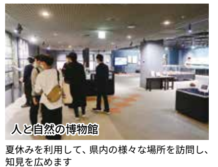
人と自然の博物館