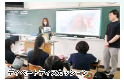
ディベートディスカッション