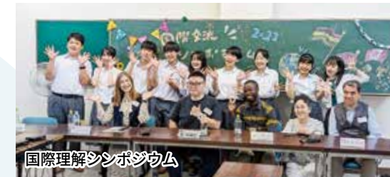
国際理解シンポジウム