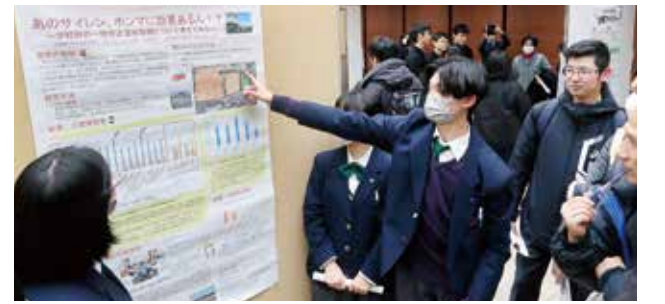
研究成果を外部でポスター発表し、他校と交流します

2年生では 「自然科学Lab」「人文社会Lab」「教育Lab」「国際関係Lab」の4つのセミナーに分かれてプロフェッショナルLabとして課題研究に取り組みます。それぞれのLabは大学や企業などの団体と協働します。またActive Lab IIでは連携団体と協力しながらフィールドワークを実施します。得られたデータは整理して、発表する準備を整えます。さらにマレーシアのテララズ大学と研究結果を比較し、成果は外部発表します。