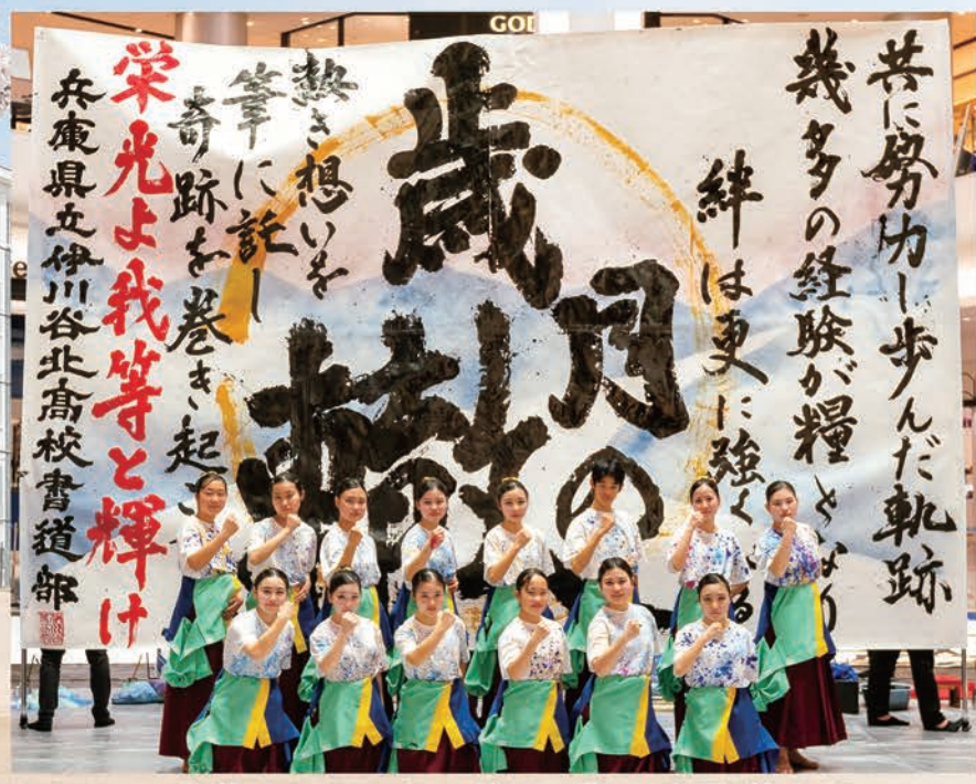
書道パフォーマンスグランプリ 全国3位!