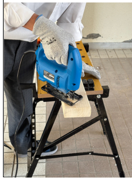
LHR・放課後と大忙しで準備・練習をしています。

6月12日（金）・13日（土）の二日間、文化祭が実施されます。一日目は、午前中に文化部の発表、午後は二日目に向けて準備となります。二日目は、午前中にクラス合唱と学年合唱（校歌）、合唱が終わり次第、模擬店・縁日が始まります。二日目は、土曜日に開催しますが、ご来場は、保護者とその家族や近隣中学校など本校が認めた方々としていきます。ご注意ください。今年度は、校舎が長寿命化工事をしているため、駐車場が通常より狭いです。乗り合わせで来ていただけますと、幸いです。