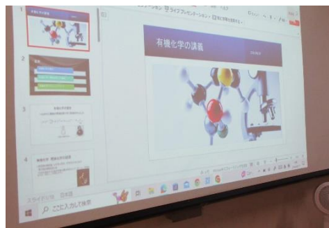
今回使用したスライドの一部です。