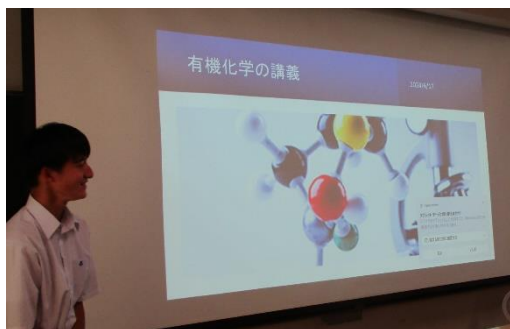
ミニ講義が始まりました。

先生役の生徒は、自作のスライドを用いてミニ講義を行い、有機化学に興味をもった経緯や有機化学の概略の説明、アプリを活用した学習の実践例の紹介をしました。アプリは、芳香族化合物の整理や理解につながる内容で、他の生徒たちは、アプリを実際に操作して使ってみたり、先生役の生徒に質問したりして、有機化学に対する興味・関心が高まりました。