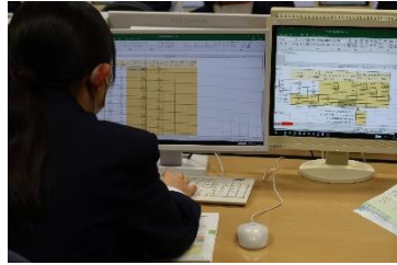
エクセルの基本操作を学ぶ様子

第76回文化祭において3年生の研究発表を聞きました。内容と説明に圧倒されながらも自分たちの目標が明確になったと思います。また、個々の観点で研究発表を評価し、メタ認知向上に向けて今後の授業を展開していきます。