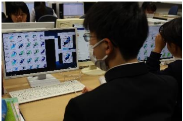
先行研究を調べる様子

具体的なテーマを掲げ、研究計画を立てるために先行研究を調べているところです。今年度は先輩の研究を継続するグループが増え、より深化が期待できます。また、自然科学やデータ活用など13グループそれぞれのテーマに合った専門家に依頼をしています。