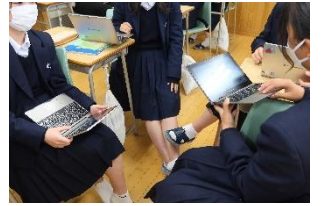
グループで研究テーマを考える様子

自分たちの研究テーマを具体的にするため「マンダラート」を活用しています。キーワードを並べることで探究したいことが絞られていきます。また「対話型論証」という考え方をもって、一方的な結論付けではなく、様々な角度から意見を取り入れていくことで信憑性を高めていきます。