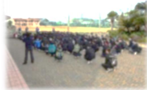
新入生登校日の様子