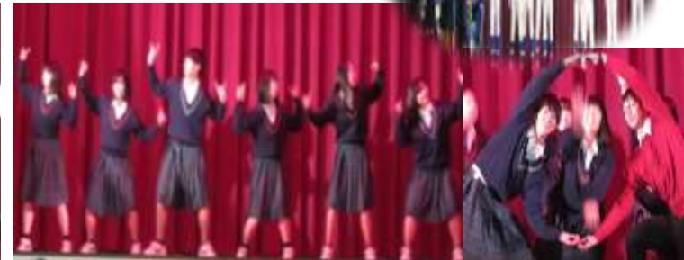
・生徒会役員によるダンスパフォーマンス