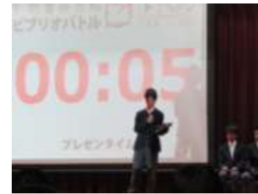
・ビブリオバトル