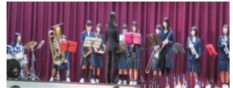
・吹奏楽部と野球部とのコラボ