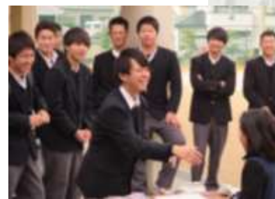
・総合学科発表会と展示・販売の様子