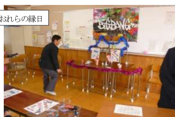
1年2組 おれらの縁日