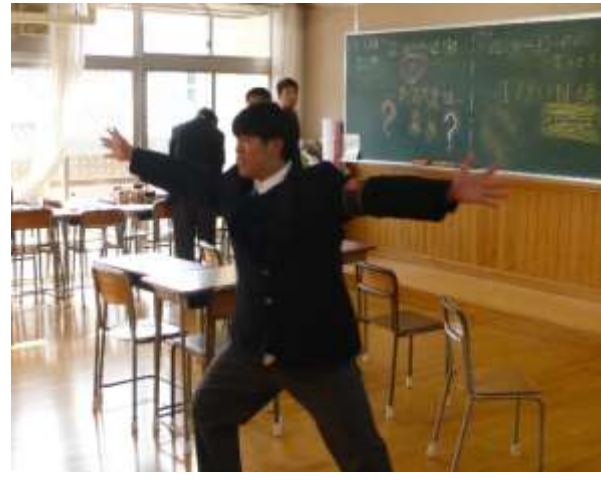
1年3組男子 YDS~やればできる3組~ 1年3組女子 #Photogenic in 1-3