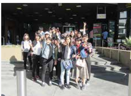
アメリカ海外研修