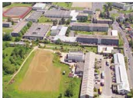
フランスクロミエ総合高校