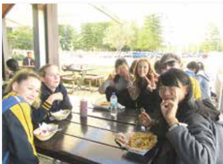
オーストラリアとの相互交流