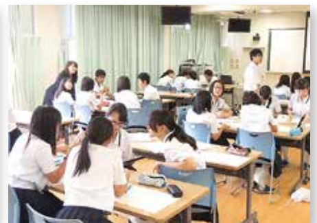
特別非常勤講師の授業