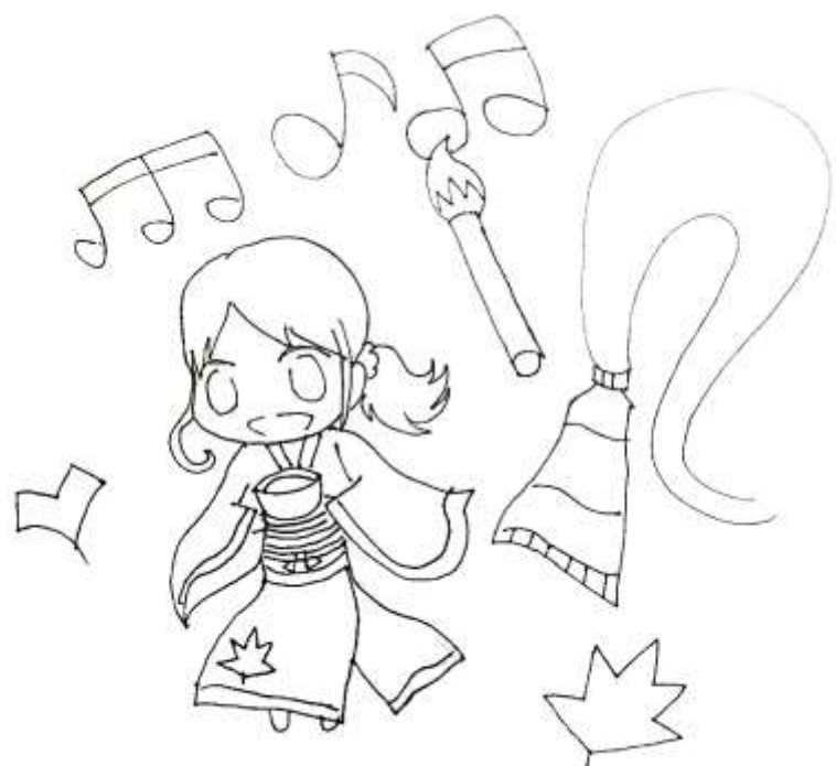
高等部1年 北村 絢凧