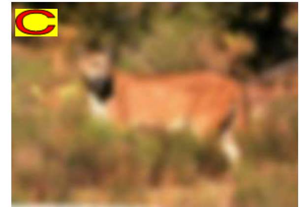
こちらは、元の画像です。