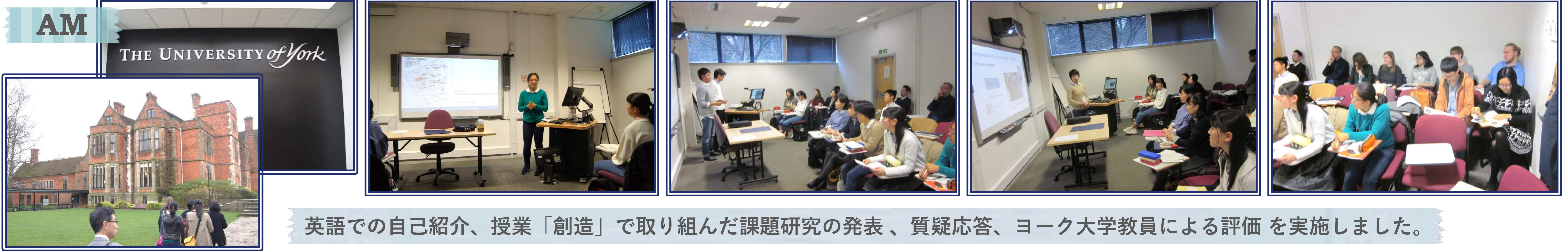
英語での自己紹介、授業「創造」で取り組んだ課題研究の発表、質疑応答、ヨーク大学教員による評価を実施しました。