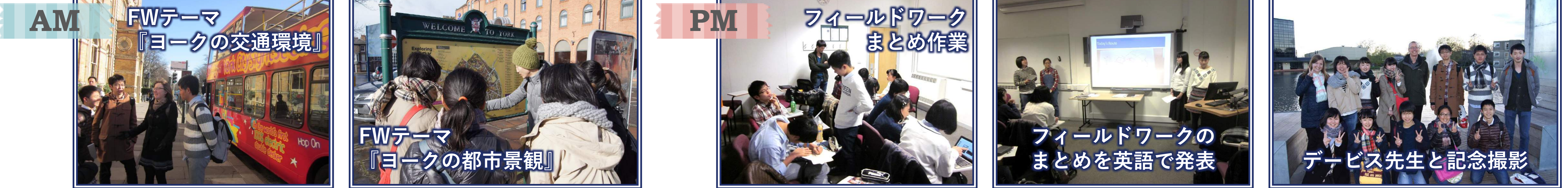
ヨーク大学の大学院生、ロンドン大学留学生、エジンバラ大学留学生(本校OB)の方々にFWのサポートをして頂きました。