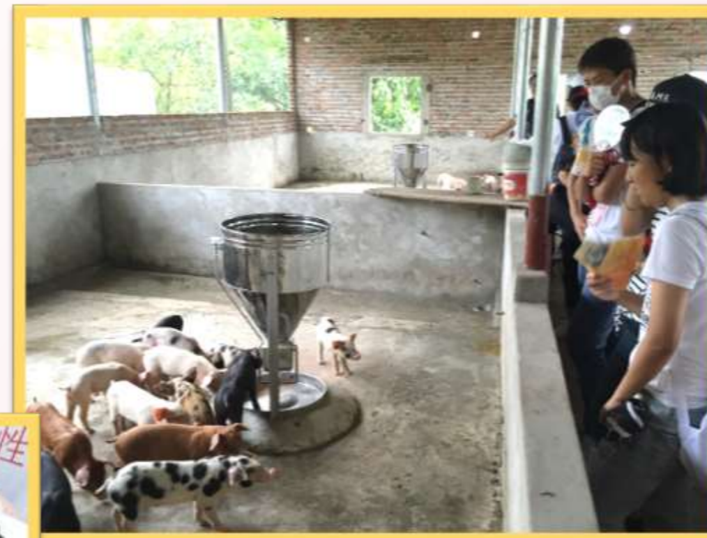
Vinh Phe地区民家訪問 家畜小屋の見学