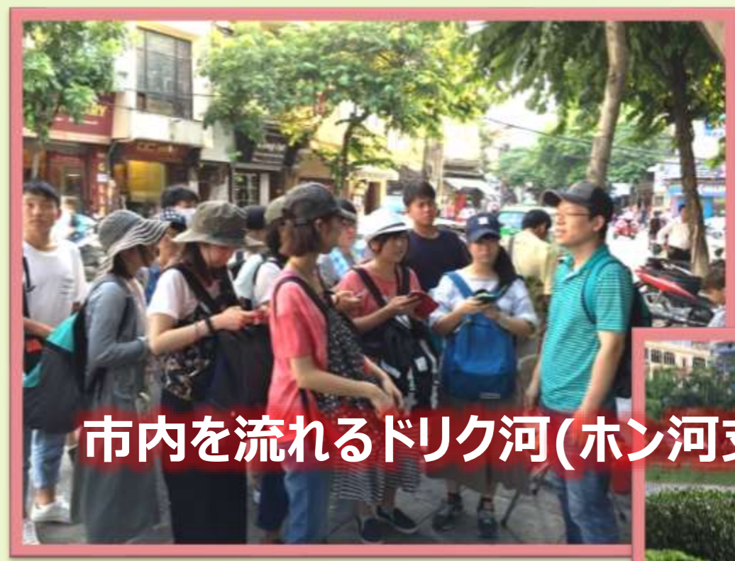
市内を流れるドリック河(ホン河支流)の汚染