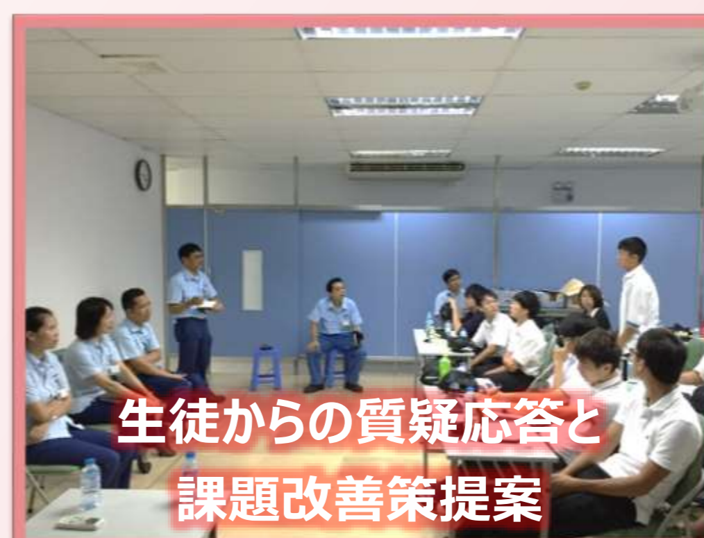
生徒からの質疑応答と課題改善策提案