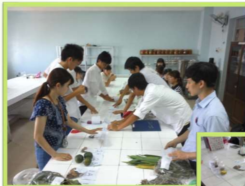
フエ医科薬科大学にてベトナム市場で購入した薬草・果物の成分分析実習