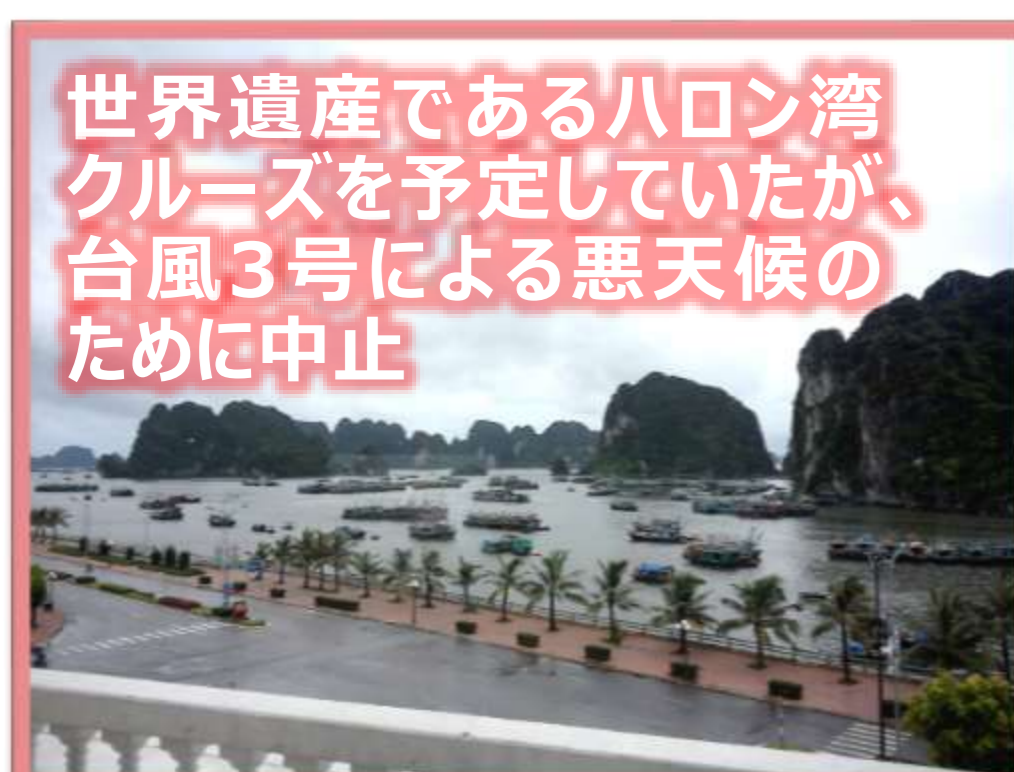
世界遺産であるハロン湾クルーズを予定していたが、台風3号による悪天候のために中止