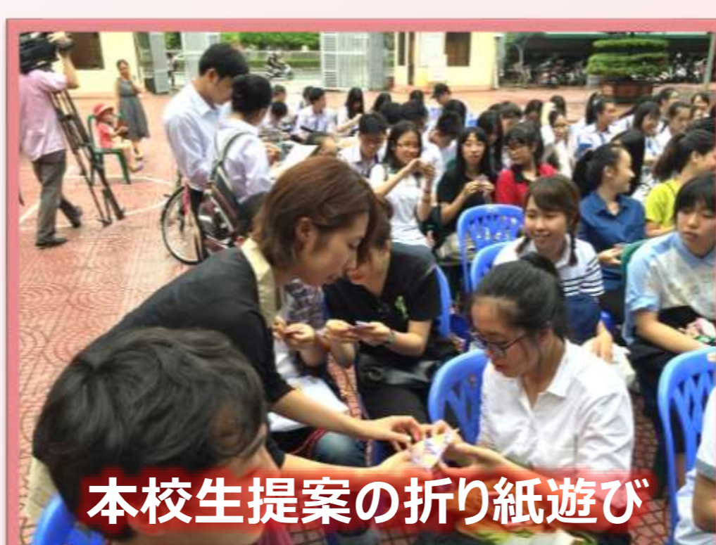
本校生提案の折り紙遊び