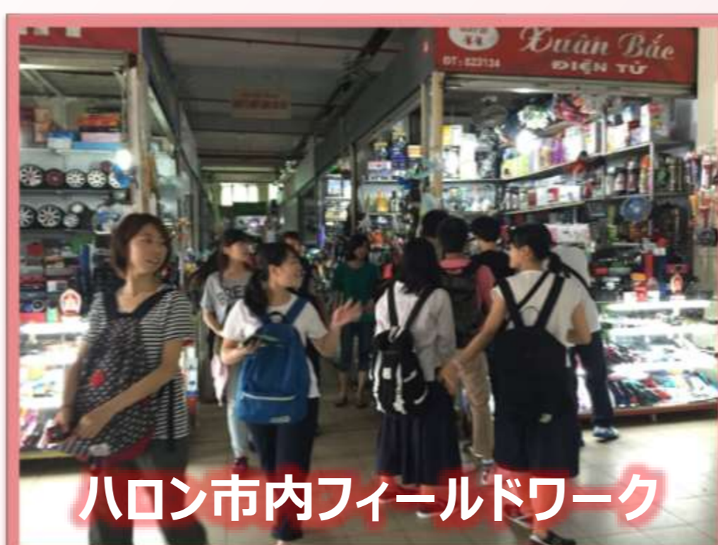
ハロン市内フィールドワーク