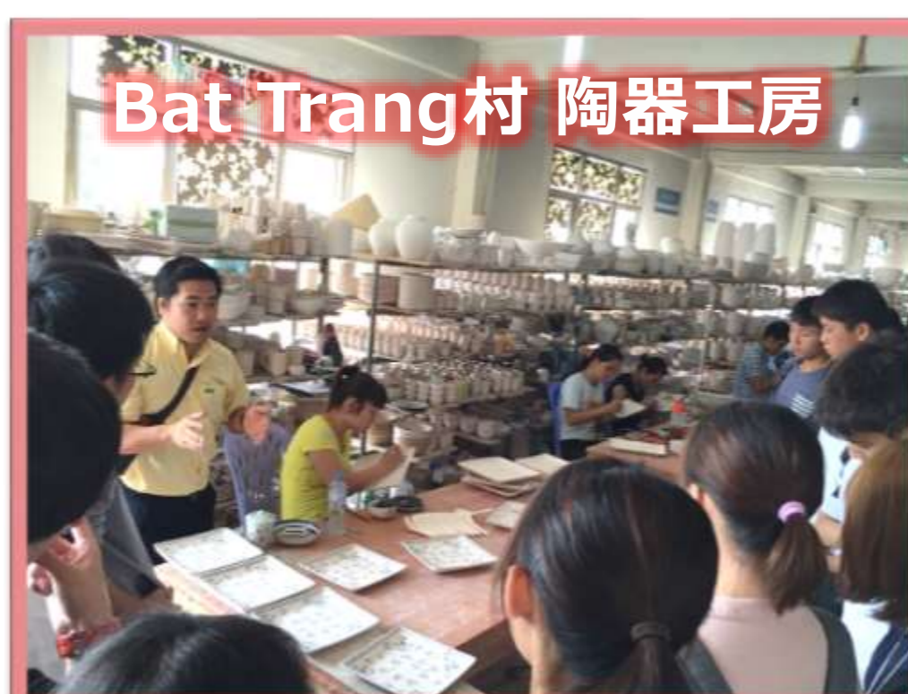
Bat Trang村 陶器工房