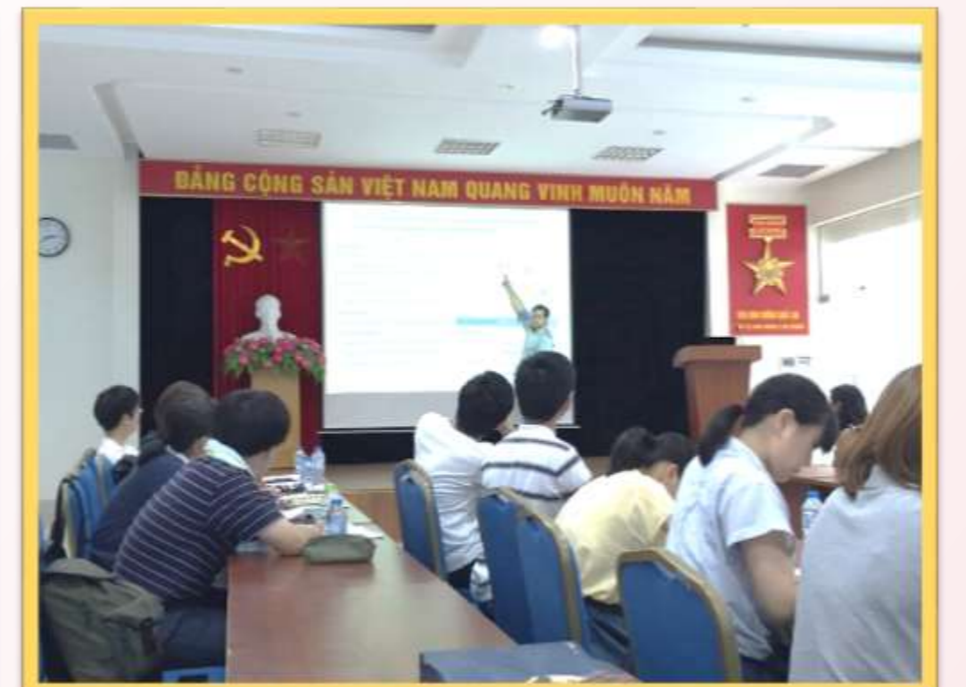
国立栄養院にて多剤耐性菌のモニタリングシステム構築についての講義