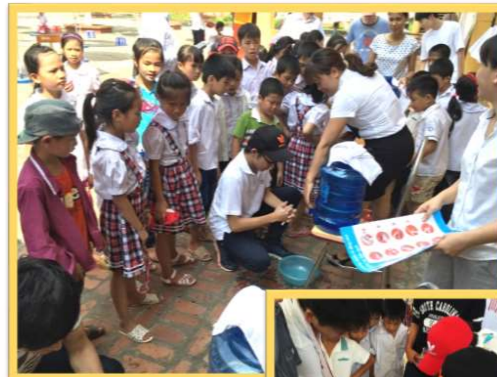
Chu Minh小学校にて「薬剤耐性菌予防の交流会」に参加