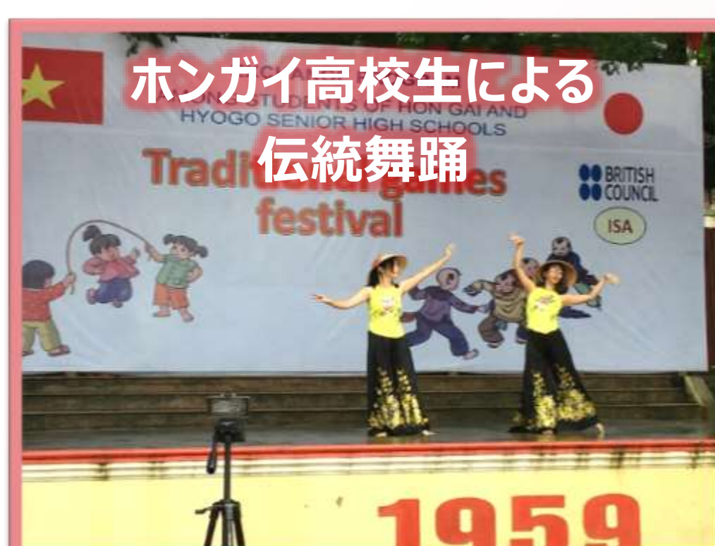
ハングイ高校生による伝統舞踊 festival