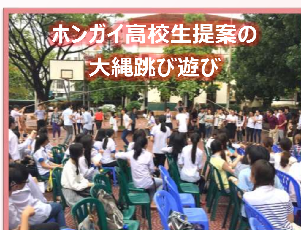
ハングイ高校生提案の大縄跳び遊び