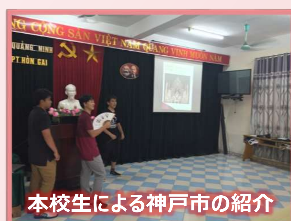
本校生による神戸市の紹介