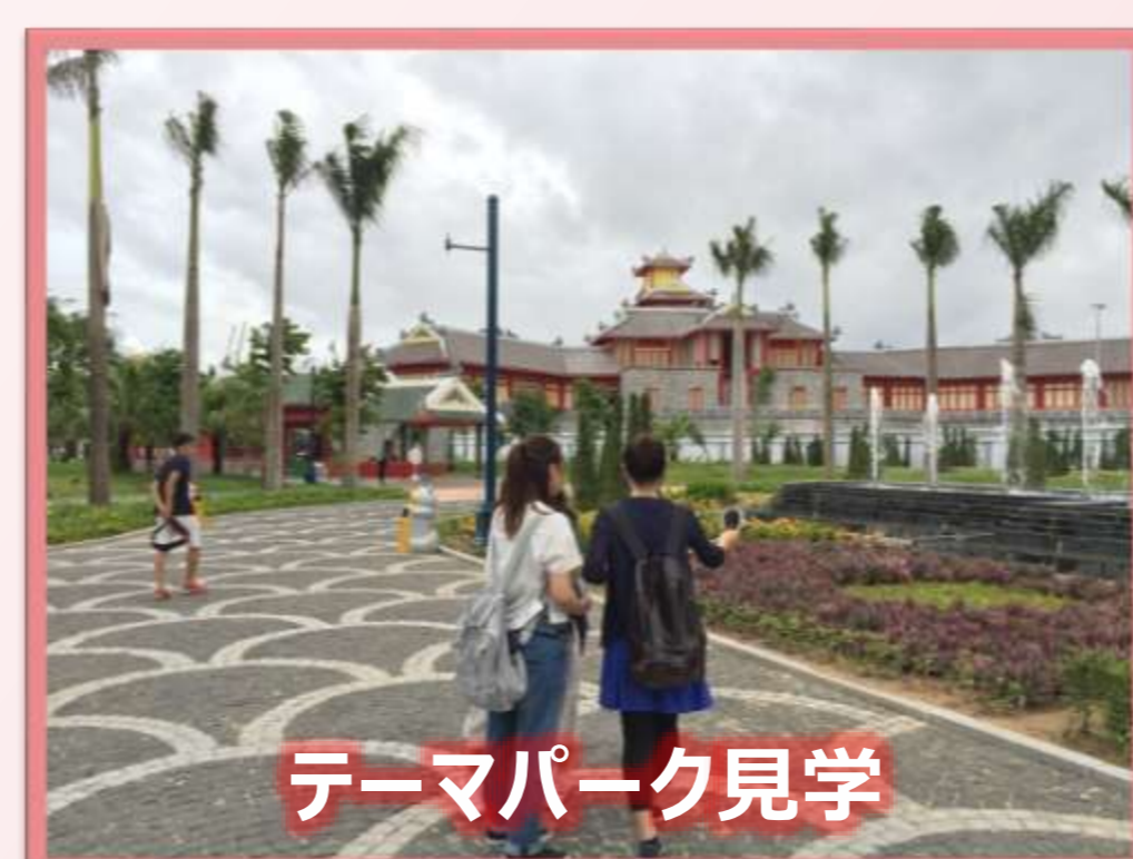
テーマパーク見学