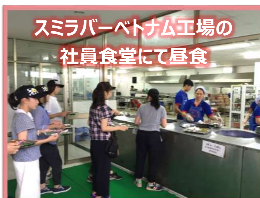
スミラバーベトナム工場の社員食堂にて昼食