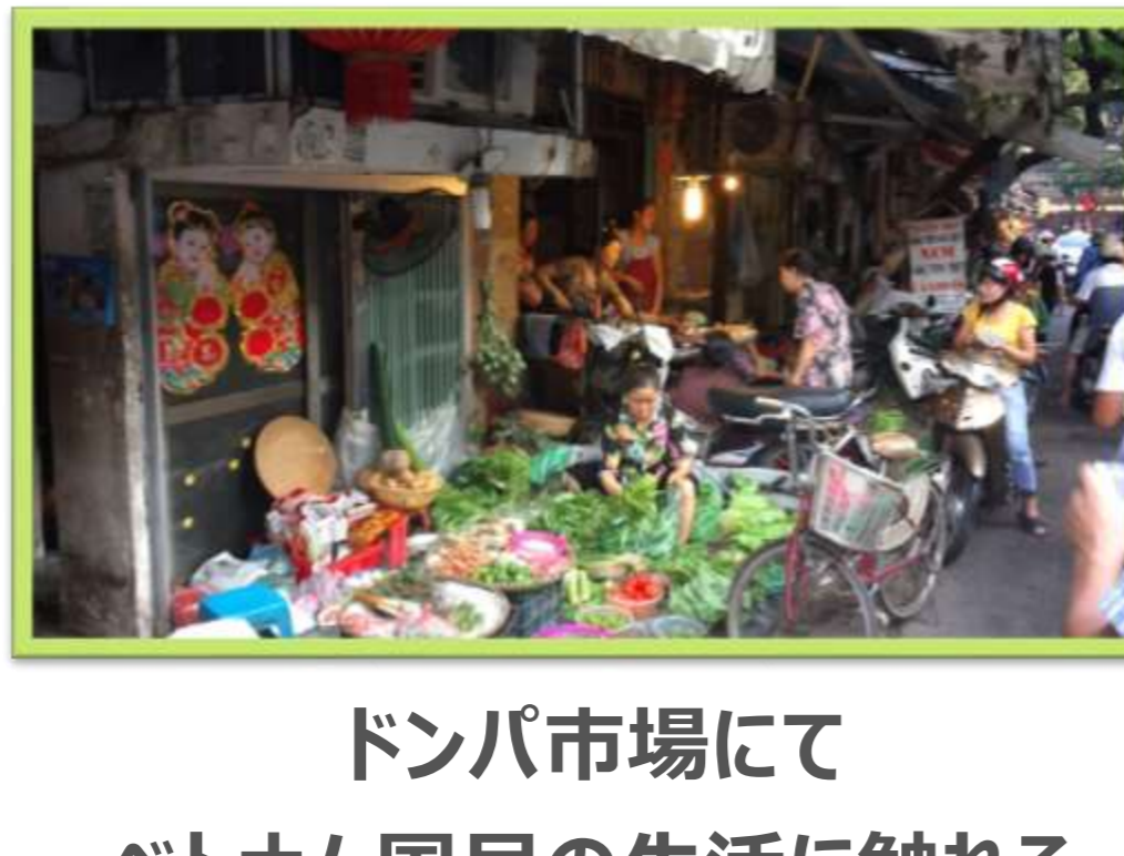
ドンバ市場にてベトナム国民の生活に触れる