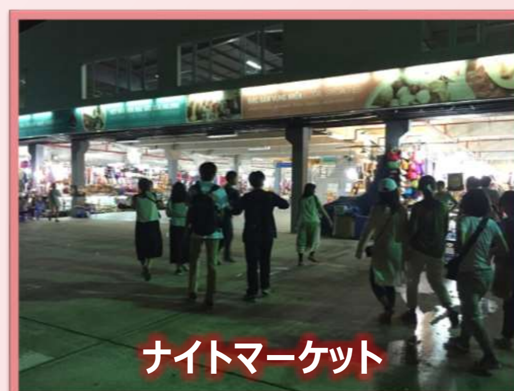
ナイトマーケット