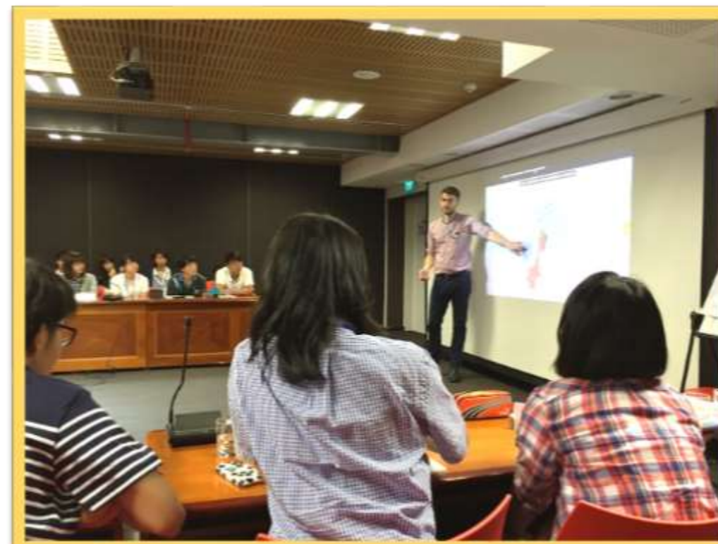
WHOスタッフによる持続可能な医療システムについての講義