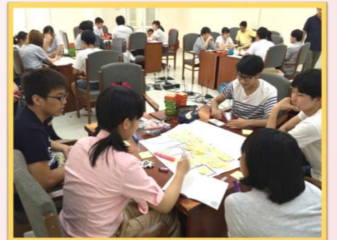
国立栄養院にて、薬剤耐性菌の発生機構・食品管理の現状と課題についての課題設定と改善策の提案