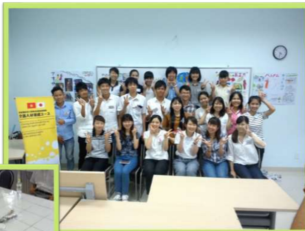
併設する介護士養成施設の学生と交流