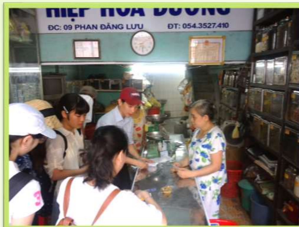
フエ市場内にて漢方薬になる薬草の購入