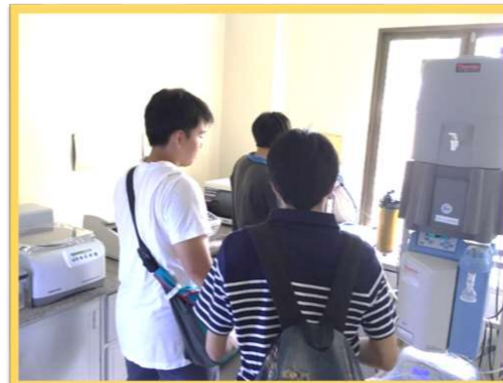
国立栄養院にて、多剤耐性菌等検査機器の施設見学