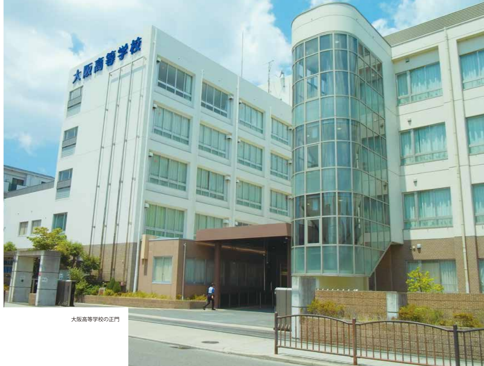
大阪高等学校の正門