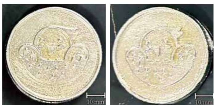
鑄造した金属モチーフ 直径51mm 左:Amazon8号珪砂<篩い済> 右:石見6.5号珪砂<島根県産>