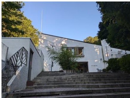
神戸市立自然の家

今日のスケジュールは、6:00起床、午前の部が8:00から10:50まで3講座、午後の部が12:45から17:45まで5講座、講義・演習中心の授業です。夕食を挟んだ夜の部は、20:00から21:50まで自習時間で1日の復習や予習をしています。午後の部の様子を見ましたが、長時間の学習にもかかわらず、集中して勉強している姿に感心しました。合宿効果で、このあとの夏休み期間中も、目標に向かって頑張れると思います。余談ですが、今日の昼食は、教員特製カレーでした。先生方が愛情こめて、全員分のカレーをつくって食べました。おいしかったかな?午後の部終了後、全員で今後の健闘を誓いました。